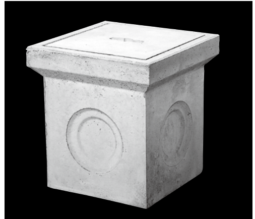
形状及び寸法 (単位: mm)