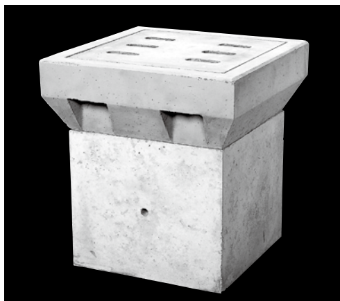
形状及び寸法 (単位: mm)