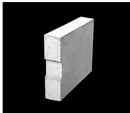
ふたの形状、寸法及び配筋 (単位: mm)