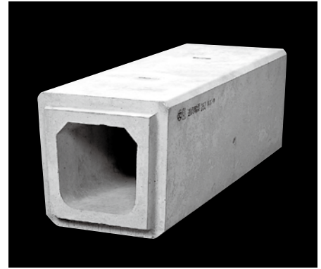
本体の形状、寸法及び配筋 (単位: mm)