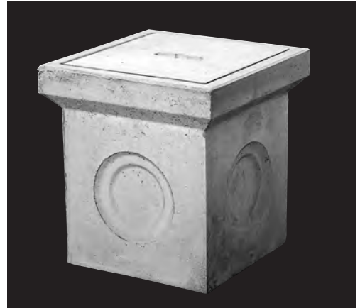
形状及び寸法 (単位: mm)