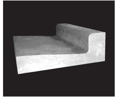
形状、寸法及び配筋 (単位：mm)